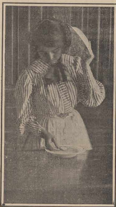
Fig. III.—El tic tac no parece provenir del reloj sino más bien del plato vecino al oído