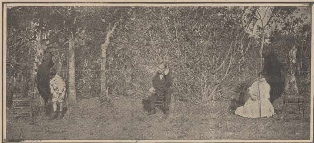
Fig. II.—Un tercer experimentador, colocado entre los otros dos, no entiende ni una palabra de la conversación