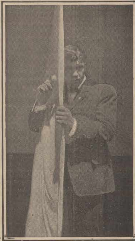
Fig. I.—El tic tac se oye fácilmente á través del tejido seco, pero el tejido mojado intercepta el sonido